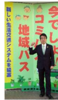
白子町(駅から西へ400m)に開設の後援会事務所にて

本年2月議会では、運賃無料で6路線運行し年間利用者が70万人を超える刈谷市(人口15万人)の例も示しながら、多くの市民が利用し親しまれる地域交通を検討することを求めました。